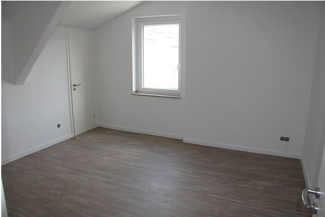
Zimmer mit AB