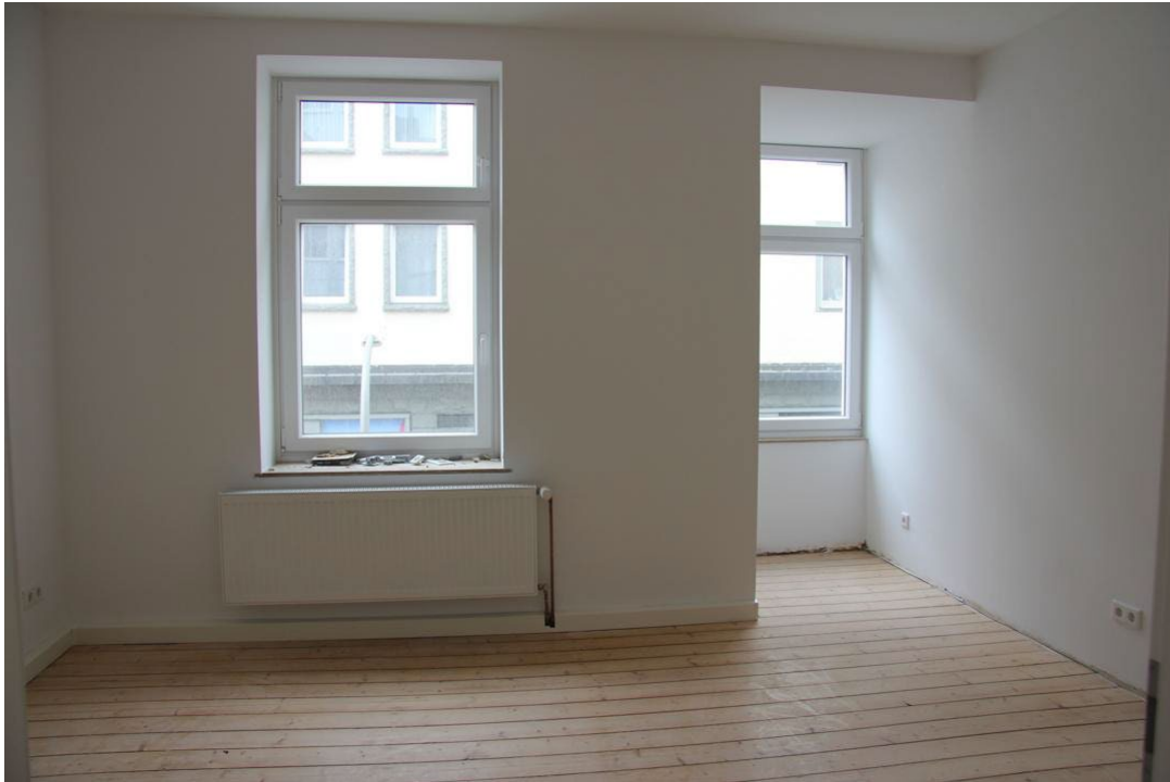
Wohn- und Schlafzimmer