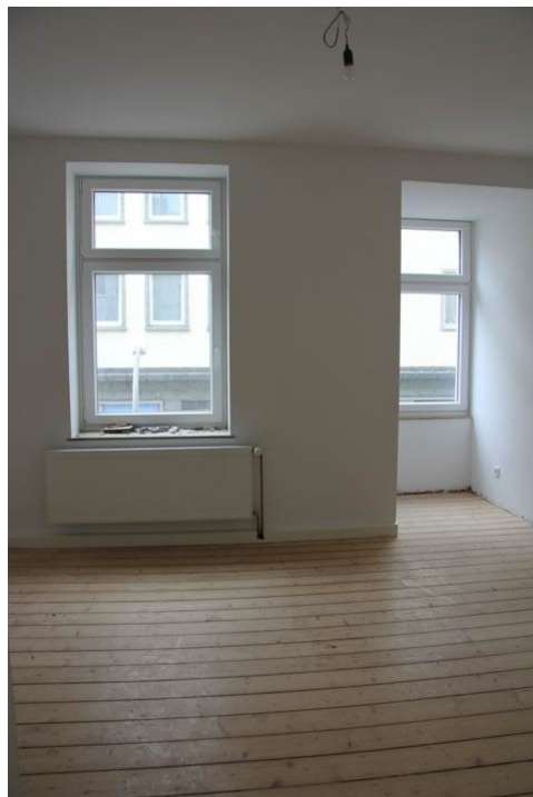
Wohn- und Schlafzimmer